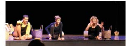
La compagnie grenobloise Sur le tas s'est inspirée du monde de Claude Ponti pour son spectacle.

Des paniers, il y en a partout sur la scène ; un piano, il y en a un. Les paniers servent de chaussures, de visages et de corps et font partie d'un monde imaginaire où circule une humaine. « On s'inspire du monde de Claude Ponti, un monde farfelu, de la quête, des découvertes, de l'enfance. Le virelangue "panier-piano" est voué à se